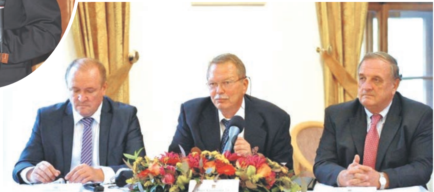
經濟俱樂部的共同主席們在頒獎典禮上傾聽徐榮祥的演說。

榮祥的燒傷再生技術和藥品，列入中國國家重大科技成果和國家新藥，全國推廣普及。他是「人體器官再生復原科學」(HBRRS)的發明者和創始人，同時還是