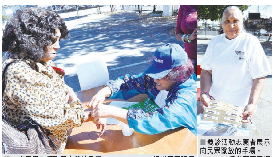
一名民眾在領取周末義診手環。

眼鏡、洗牙拔牙矯正牙齒、以及各類相關醫療服務。由於昂貴的牙醫費用，有牙科服務需要的民眾最多，牙科手環在開放發放的幾小時後就被搶空。 穆哈默地表示，雖然「奧氏健保」已經緩慢推行，但是義診活動還將每年繼續開展下去。義診活動旨在幫助有需要的民眾，不分種族、身份與年齡性別。「奧氏健保」全面推行後，加州仍舊會有近300萬的包括非法移民在內的民眾，沒有資格申請加州的健康保險，而健康醫療服務不可或缺，所以義診也會繼續下去。